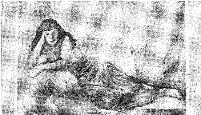
ابنة الساحل - انصير شوري

احد اساتذة كلية الحقوق في الجامعة السورية فقال : ( ان مثل هذا المرض لتشجيع الرسامين والنحاتين السوريين وتشيطهم وتصريف انتاجهم ؛ ولزام علينا ان نعترف ان هذا التشجيع كان عاملاً أساسياً في تقدم الحياة الفنية السورية وانتشار الدعوة في مجتمعاتنا لتذوق آثارها ، فقد نشأ منذ اربع سنوات عدد من النوادي والجمعيات الفنية وتمددت المعارض الخاصة في العاصمة وتحسن الانتاج الفني .. حتى اتى هذا المعرض . وسوف تشاهدون ان الفن السوري قد شب عن الطوق واصبح لدينا ولله الحمد فنانون بطرقون كل مواضع التصوير والنحت ويجولون في كل ميادين الابتكار والابداع ويتبعون المذاهب الفنية الكلاسيكية كما يجاورون المذاهب الجديدة كالانطباعية الحديثة والرمزية والسريالية والتكيفية وغيرها التي يتبناها الفنانون الغربيون المعاصرون ) .