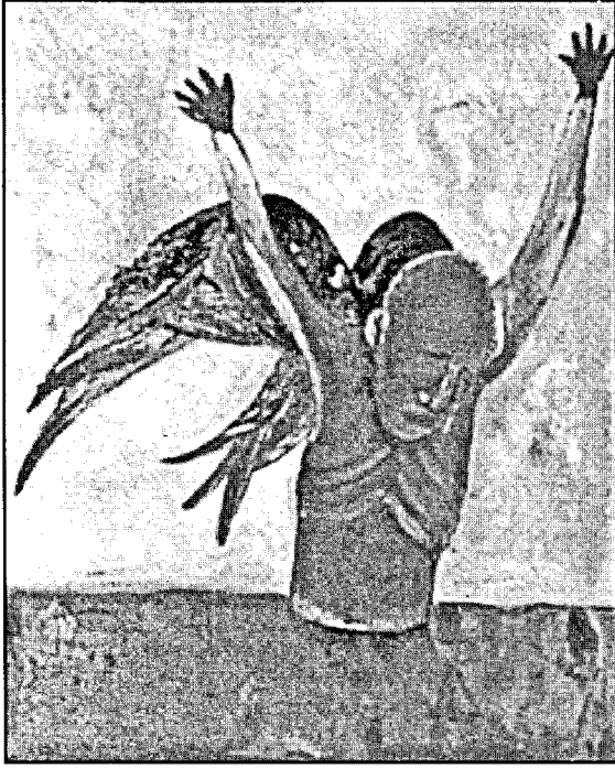
أكريليك، بريشة برايتن برايتنباخ (١٩٩٣)

كان الشعر، أفلا يكون بُعدَ قرونٍ غيرُهُ؟ وفي نقطةٍ بدءٍ معينة، نشأت الرواية والقصة، أفلا يولد غيرُهُما؟ ثمة مَنْ يستسهل الإجابة ليقول: «نعم يكون غير ذلك». ولكنك حين تسأله كيف ذلك، أو «افعل» غير ذلك، يمضي إلى ما فعله السابقون، فيكرّر متوهماً الابتكار.