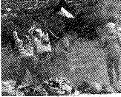
ما يحدث الآن في فلسطين ليس انتفاضة بل إحباط شعبيّ يستخدمه عرفات لخدمة ديبلوماسيته

أحبّ أن أتحدّث معك عن الهبة الجديدة في فلسطين، المعروفة باسم «الانتفاضة ٢»، مع أنّ توماس فريدمان الذي يكتب في نيويورك تايمز قال في البداية إنّ الانتفاضة الجديدة لا تحمّل معنى الانتفاضة الأولى لأنها لا تحمل الاسم ذاته. لقد أمضيت وقتاً طويلاً في فلسطين أثناء الانتفاضة الأولى، وكان كتابك: صعود فلسطين وأقولها عن هذه الانتفاضة.* فكيف تقارن بين الانتفاضتين؟