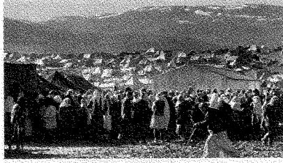
إسرائيل لا تعترف أصلاً بمسؤوليتها عما جرى

المسألة الرابعة: القدس. سينال الفلسطينيون بعض الأحياء التي لا يريدونها الإسرائيليون لأنهم لا يريدون أن يجمعوا قمامة العرب ولا يريدون أن يدفعوا أي قرش للمدارس العربية. ولهذا سيحصل الفلسطينيون على أحياء عربية مطوقة تماماً بأحياء يهودية. سينالون جزراً صغيرة في القدس الموسعة. وسيحصلون أيضاً على الطابق الثاني من المسجد الأقصى... بل لن يحصلوا على هذا الطابق أيضاً لأنهم سوف يُعطون السيطرة على القدس لا السيادة عليها!