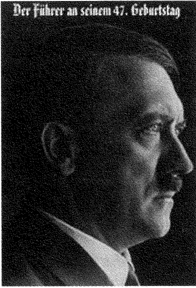
النازية ليست انحرافاً مصدره رجل واحد، وهتلر ليس بدعاً

أولاً، ليس هناك من يماري في أنّه لم يكن إنساناً سوياً. في نهاية الحرب لم يكن سوياً حين علم أنّه بدأ يحسّر هذه الحرب، فتصرّف بطريقة يتبعها كثير من القادة حين يُوشِكُون على الخسارة. في رأيي أنّ السؤال قد طرَحَ بشكل خاطئ، وذلك لسببين. أولاً لأنّه يوحي بأنّ الظاهرة النازية كانت نوعاً من الانحراف النفسي، أو الرّيع عن الأعراف، أو المرض السياسي؛ وهذا ليس صحيحاً في اعتقادي. وثانياً لأنّه يوحي بأنّ الأشخاص العاقلين يتصرّفون بطريقة أكثر إنسانية، ولا أظنّ أنّ هذا صحيح جداً هو الآخر؛ فالتاريخ مليء بالسفّاحين العاقلين جداً والصارمي الإدارة. إنّ الأمر لا يتطلّب عقلاً مجنوناً لكي تحصل جريمة جماعية على مستوى واسع. فالأشخاص الذين يتمتّعون بالصحة العقلية الكاملة أكثر قدرة على ارتكاب جرائم واسعة!