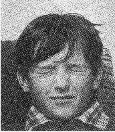
من نجا؟ من لم يُعذب أصلاً؟

أفهم ما كان سؤالك يرمي إليه. ليس ثمة ما هو غير مألوف في ذلك كله. فحين تحل كارثة طبيعية، كزلازل مثلاً، ويُعطى البلد المنكوب مساعدة، ماذا يحلّ بالمال؟ في المكسيك؟ في السودان؟ الخ... إن ما يحدث دائماً هو أن حوالي ٩٠٪ من أموال الإغاثة تُنهب. وهذه علة ملازمة لأي توزيع للأموال، حين لا يكون ثمة ضبط ديموقراطي للأموال نابع من القاعدة الشعبية. ولكن المسألة الأكثر تعقيداً هي كيف تُحلّ قضية حق العودة. في رأيي أن السمة الأبلغ [للانتفاضة الثانية] هذه، بالمقارنة مع سابقتها، أنها وضعت مسألة حق العودة في وسط المسرح. عليك أن تتذكر أن أوج الانتفاضة الأولى كان «إعلان استقلال دولة فلسطين» في تشرين الثاني (نوفمبر) ١٩٨٨. آنذاك كانت المسألة الأساسية هي تأسيس الدولة المستقلة، ولم تُذكر مسألة حق العودة. أمّا اليوم فهذه المسألة هي نقطة مركزية لحل الصراع.