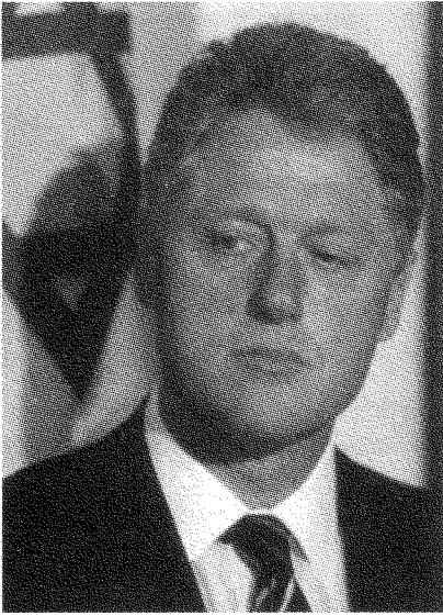
كلينتون حاول أن يقايض «حق العودة» بإعطاء عرفات السيطرة على «الأقصى»

لم يكن لدى الولايات المتحدة إحساساً قاطعاً بأن إسرائيل هي الرصيد الحيوي والأوحد لقوتها في الشرق الأوسط. وكان هذا هو إلى حد كبير إحساس البريطانيين أيضاً. فلقد دَعَمَ البريطانيون إنشاء الدولة اليهودية، ولكن رادتهم الشكوك أحياناً. كان ثمة بالتأكيد انقسامات داخل النخبة البريطانية الحاكمة إزاء مسألة إسرائيل، وبعض البريطانيين اعتقدوا أن هذه المسألة ستزيد من ابتعاد العرب [عن البريطانيين]. وقد تَكَرَّرَتْ هذه الانقسامات بعد ذلك في النخبة الأميركية الحاكمة حين صارت الولايات المتحدة قوةً مهيمنة: فمثلاً لم يكن وزير الخارجية مارشال ميلاً على الإطلاق إلى الدفاع عن إسرائيل ولا إلى تأسيسها. ولم يَدْعُمَ الرئيس ترومان هو الآخر إنشاء إسرائيل، وإن اعتقد أن ذلك الدعم سيفيدهما في كسب أصوات الناخبين اليهود. في الفترة الممتدة بين عامي ١٩٤٨ و ١٩٦٧ ستلاحظ الكثير من المشاعر الأميركية المتضاربة حيال إسرائيل. فإثناء حُكْمَ آيزنهاور كانت المعارضة الأميركية لإسرائيل ربما تفوق التأييد لها. ومع ذلك كانت هناك صراعات مختلفة على مياه المنطقة، وقد دَعَمَ آيزنهاور إسرائيل، وبلغ الأمر ذروته في حرب السويس. ثم بدأت الأمور تتغير في أوائل الستينيات عندما فُقدت الولايات المتحدة الأمل في توجيه قومية عبد الناصر العربية وجهةً «معتدلة»، وازداد عبد الناصر تحالفاً مع الاتحاد السوفياتي، وبدأ يصبح أكثر استقلالاً. وحين جاء كينيدي ازداد تحالف الولايات المتحدة مع إسرائيل، واشتدَّ قوةً أثناء حكم إدارة جونسون*.