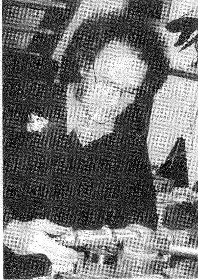
ويلكومرسكي: افتضح أمره، لكنهم لم يسمّوه دجالاً ولا محتالاً!

فيزل لا أهميّة له. ولكنّ ما يجعله شخصاً لافتاً للانتباه هو كونه تجسيداً لما ألت إليه الهولوكوست [كإيديولوجيا] في الولايات المتحدة، وذلك من حيث: دفاعه غير المشروط عن إسرائيل وعن اليهود، واعتباره كلُّ الأغيار أشراراً وكلُّ اليهود أحياناً. إنّ تجسيداً للهولوكوست إيديولوجيةً ومصدرٌ رزق. إنّهُ