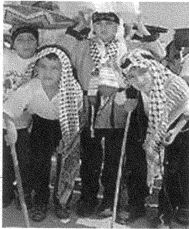
الاعمال اللاأخلاقية لا تصبغ أقل لاأخلاقية بمرور الزمن: أطفال يعيدون تمثيل نكبة ١٩٤٨

أشبه بالأم تيريزا حُباً لبني البشر! غير أن الفارق الحاسم هو أن اللاأخلاقية في حالة إسرائيل أكثر توافقاً لأن «الآخرين» هنا - خلافاً للمهاجرين الأجانب في أوروبا - هم في الحقيقة أبناء الأرض الأصليين، الذين طردوا منها ويتوقون للعودة إليها. والمعادل الأحدث لأزمة اللاجئين الفلسطينيين هو ما حصل من معاناتهم للكوسوفيين، الذين طردوا من قراهم وبلداتهم ثم عادوا لاحقاً بعد حرب وجيزة ولكن «مظفرة» خاضها حلف الناتو ضد معذبيهم. يكتب جدعون ليفي، عاقداً الصلة بين الأزمتين ببصيرة نقادة: