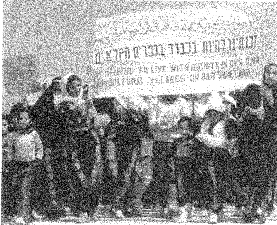
دُهِشَ أَكْثَرُ الإِسْرَائِيلِيِّينَ لانتفاضة فلسطينيي ٤٨ الذين «تجاهلوا امتيازاتهم»

طاغياً بالخيبة، إن لم يكن بالخدعة، من أعمال «الإسرائيليين العرب» التي «لا يُمكن أن تُفسَّر» نظراً لأن هؤلاء «تجاهلوا كلَّ امتيازاتهم» في إسرائيل وخرَّجوا إلى الشوارع بقوة ليعبِّروا عن دعمهم المتَّقد للفلسطينيين في الضفة وغزة؛ وذهبت بعض وسائل الإعلام إلى حدِّ اتِّهامهم بانتهاج سياسات «الطابور الخامس». فاتَّخذت تدابير «احترازية» عسكرية قرب البلدات العربية، وذلك بعد أن سمى تقرير أمني صادر عن أرفع المستويات سكان تلك البلدات «جماهير معادية» (٣) تهدد «الأمن اليهودي». وفي زلَّة لسان واضحة عبَّر الرئيس الإسرائيليُّ موشيه كاتساف عن عرفانه لكون «أعمال الشَّعب قُرِبت الإسرائيليين بعضهم من بعض»، متناسياً أن خُمس المواطنين «أي عرب إسرائيل» كانوا يتلقَّون الرصاص الحي والملازمة والدعايات المبيضة. (٤) ويُمكِن اعتبار تلك الاتِّهامات الموجهة إلى العرب نتيجةً طبيعيَّة لإدراك الإسرائيليين اليهود المضطرب لـ «الإسرائيليين العرب»، ونتيجةً طبيعيَّة - من ثم - لتوقُّعاتهم المضطربة من هؤلاء. بل إنَّ «اليسار الصهيوني» نفسه، كما يحاجج عضو الكنيست د. عزمي بشارة، «يؤمن أنه يملك الصورة الصحيحة عن العرب ثم يفاجأ حين لا يرقى العرب إليها!» (٥)