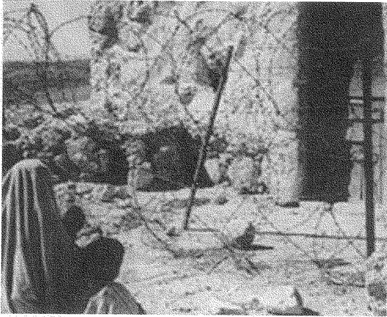
أنشئت إسرائيل على أنقاض فلسطين، والتعويض الوحيد هو إزالة الاستعمار