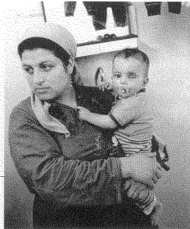
«هناك ممارسة شائعة وهي إطلاق رصاصة معدنية مكسوة بالمطاط على العيون مباشرة» (تانيا رينهارت)

الجيش الإسرائيلي، فقال: «صُعقت لرؤية جنود [إسرائيليين] يَجْرُونَ شاباً فلسطينياً مدمى في شوارع الخليل. لقد أظهرت هذه الصورة الصادمة جنودنا أناساً ساديين يَيْتَهجون لقتل شاب، ولجروا جسده إلى المستوطنين لكي يَيْتَهجوا هم أيضاً ولكي يُرَقِّصوا ويتبادلوا الطلوى والتهاني وليُرفسوا الجسد الذي لم يَمُتْ بعد». وبمناسبة ذكر التهاني، فإن الزعيم الصهيوني مناحيم بيغن - بُعيد إذاعة أبناء مجزرة دير ياسين عام ١٩٤٨، حيث قُتل ٢٥٠ مدنياً فلسطينياً على يد منظمتي إرغون وشتيرن الإرهابيتين - أرسل رسالة سريعة إلى المهاجمين يقول فيها: «تقبلوا التهاني على هذا النصر الرائع. أخبروا الجنود أنكم صنعتم التاريخ في إسرائيل.» (٧) وبالعودة إلى الضابط الإسرائيلي السابق الذي يملك وازعاً من ضمير، فإنه يواصل حديثه قائلاً: «إن ذلك يذكرني بالفهود الشيتا والضباع، التي تُقتل فريستها ثم تجرّها. ولكن المشكلة هي أن هذه الحيوانات تُقتل لتعيش، في حين أن جنودنا يُقتلون ليحافظوا على الاحتلال الذي هو نظام فصل عنصري [أپارتايد].»