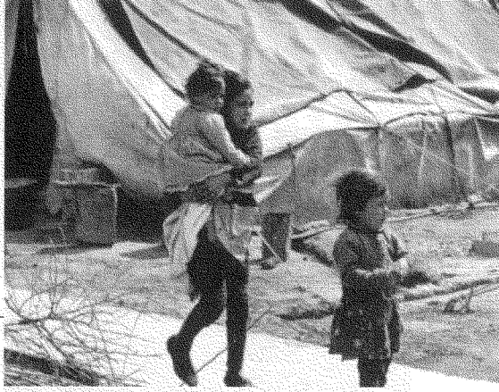
الحل القائم على دولتين يشرع حصيلته المرحلة الأولى من الاستعمار الصهيوني

هذا الشرط المسبق لا يمكن تبريره فوراً. وعاموس عوز، مثلاً، يعتبر حق عودة الفلسطينيين انتهاكاً غير مقبول لـ «حق اليهود في تقرير مصيرهم» (١) فكيف يمكن التوفيق بين مفهوم للقومية كهذا، وهو مفهوم استعماري في أساسه، ومتطلبات إزالة الاستعمار ومن ثم متطلبات التعايش المستقبلي والسلام الدائم والتنمية؟