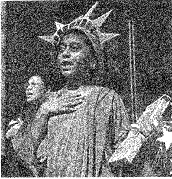
سياسار الجمهور الاميركي إلى الالتفاف من حول العلم داعماً حكومته أياً كانت بربرية سياساتها