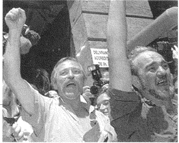
عام ١٩٩٩ حطّم بوفيه أحد مطاعم ماكدونالدز وأدخل إليه حيواناته الداجنة: لماذا نريد طعامًا مستوردًا؟