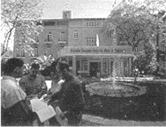
آثار الثقافة الفرنسية هاشمية في لبنان، باستثناء بعض المدارس والجامعات

الثقافية، لأننا في غنى عن تورطنا في صراع لا مصلحة البيّنة لنا فيه. فالحق أنّ مواجهتنا للعولمة الثقافية لا تكون بمناداتنا بثقافة فرنسية (مهما أحببنا شارل حلو ومهما تربينا على تعلّمها وعلى تقديرها)، بل بالدفاع عن ثقافتنا العربية في مواجهة العولمة. ويُمكن النظر إلى المستوى التسطيحي وغير المتنوع للإنتاج الموسيقيّ العربيّ الحاليّ بوصفه نتاجاً للعولمة الثقافية: فهناك تقليد للنّماذج الأميركيّ المتبدل، حتى في الإيقاع، وخصوصاً في الـ «فيديو كليب» وهو مستورد وبفضل عن نماذج الـ MTV (المحطة الموسيقية الأميركية).