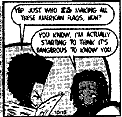
أما زالت «القومية» الأميركية تموّل الطالبان؟