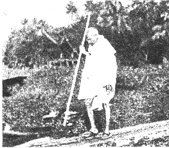
«اعترف غاندي نفسه بأن الفلسطينيين... يملكون الحق في استعمال القوة العنيفة لمقاومة الاحتلال.»

تجنيداً إلزامياً. إنَّ المسؤوليةَ الجماعيةَ تزدادُ زيادةً واضحةً كلما انتقلنا من أحدِ حدي الطيفِ إلى الآخر. فإذا التفتنا إلى إسرائيلِ فإنَّ الدعمَ الذي يقدمه المواطنون الإسرائيليون لسياسات الدولة الإجماعية، والدورَ الحاسمَ الذي يلعبونه في تطبيقها، يعينان أنَّهم يتحملون مسؤوليةً كبيرةً عن الجرائم المرتكبة. ولكنَّ الإقرارَ بهذا لا يقلُّ من أهمية التمييز الحاسم بين المدنيين والعسكريين. هل يتحمل الأميركيون الذين كانوا يعملون في مبنى التجارة العالمي في صبيحة الحادي عشر من أيلول (سبتمبر)