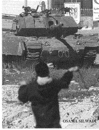
«أقصى ما يُمكن بلوغه هو الحقّ السياسي والأخلاقيّ في المقاومة»: صبي يرمي حجراً على دبابّة

في موضع رهيب هو الخيار بين الاستسلام أو الإرهاب - ولا يُجدر بأيّ شعب أن يواجه أبداً بمثل هذا الخيار، لأنه يمثل مأزقاً مأساوياً - ولكن، في الوقت نفسه، ليس هناك دعمٌ شرعيٌّ مسؤول للنظرة التي تقول بأنّ المخرج من مثل هذا المأزق هو السماح بالعنف الموجّه عمداً ضدّ الأهداف المدنيّة. وبالنسبة هناك قيّد مماثلٌ يتعلّق باستخدام العنف من قبل الدولة؛ وإسرائيل بهذا المعنى قد اختارت «الإرهاب» سببياً لحفظ «أمنها». لكنّ الإرهاب من طرف أول لا يشرعن الإرهاب من طرف ثان.