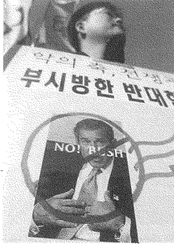
كوريا الجنوبية تنظّم ضدّ قرار بوش اعتبار كوريا الشماليّة في «محور الشر»

العلاقات الدوليّة المعاصرة. ولا شكّ أنّ الولايات المتحدة قد أدركت مؤخّراً حجم خطاها، ولا أدلّ على ذلك من التصريحات التي صدرت عن مستشارة الأمن القوميّ السيدة رايس، وفيها أوضحت أنّ عمليّة التصنيف لا تعني استعمال القوّة ضدّ البلدان الثلاث، وأنّما هي بمثابة تحذير تنتظر من ورائه الإدارة الأميركيّة أن تتّصاع تلك الدول لمواقف المجموعة الدوليّة وللقانون الدوليّ - وهو ما يؤشّر على درجات من التراجع في حدّة الخطاب الذي تحدّث به بوش أمام الكونغرس. ويمكننا بالتأكيد إحالة أسباب هذا التراجع إلى عدم تجاوب المجتمع الدوليّ مع الخطاب الأميركيّ.