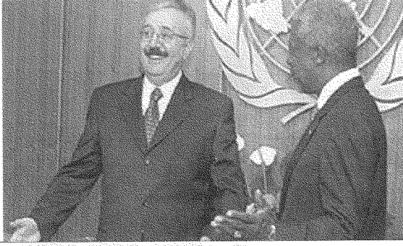
انضباط العراق في إطار القانون الدولي يزعج البساط من تحت أقدام أميركا

تعرّضت لاعتداء من طرف قوات مسلحة. لذلك تظل أميركا واهمة إن هي فكرت في استعمال القوة ضدّ الدول الثلاث استناداً إلى نظام الأمن الجماعي. ذلك أن المادة ٥١ صريحة ولا تحتاج إلى تقديرات تأويلية جديدة. كما أن حدود الدفاع الشرعي عن النفس أو عن المصالح الحيوية القومية لا يُمكن أن تطبق إلا إذا تعرّضت دولة ما فعلياً للاعتداء من قوة مسلحة - وهذا ما لم يحدث في العلاقات الأميركية مع الدول الثلاث المصنفة في إطار «محور الشر». وإذا كان قرار الجمعية العامة للأمم المتحدة يعطي تفسيراً واضحاً لمفهوم العدوان، كان تُمسّ السلامة الإقليمية أو الوحدة الترابية أو سيادة دولة عضو في هيئة الأمم المتحدة، فكيف يُمكن أميركا أن تكيف القانون الدولي لصالح نازلتها الجديدة؟ وحتى إذا اعتبرنا أن من واجب نظام الأمن الجماعي أن يتحرك في مثل هذه الظروف، فإن حركيته ستتحقق انطلاقاً من قرار يستصدره مجلس الأمن واعتماداً على قوات دولية تقوم بمهامها تحت علم الأمم المتحدة.