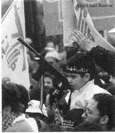
التظاهرات لا يمكنها أن تكون حبيسة التصور المنطقي والعقلاني الذي يبوره المثقفون

من سلبيات ظاهرة الاحتجاج العربي لفائدة فلسطين أنها في الكثير من المحطات النضالية ارتبطت بالتيارات القومية أو بالتيارات الإسلامية، ولم نعمل على ربط القضية بالخط الإنساني العام. وبعد الهجوم البربري على الفلسطينيين، بدأنا نلاحظ اهتماماً بهذا الأمر الذي يؤشر على إمكانية تدويل ظاهرة الاحتجاج لفائدة القضية الفلسطينية. فكيف يمكن للقوى المدنية العربية، التي تؤطر ظاهرة الاحتجاج العربي، أن تتفاعل مع هذا المعطى الجديد؟