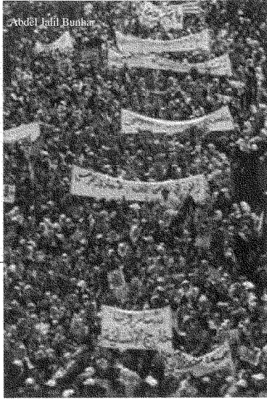
الثابت في مظاهرة الرباط المليونية هو الإجماع الذي احترم الاختلاف

بالذات ما فَرَضَ علينا الاستمرارَ في العمل الجماعي، حرصاً على ألا تصبح القضية الفلسطينية قضية تصفية حسابات داخلية، أو قضية من لا قضية له، أو مجالاً للمزايدة السياسية والمذهبية، لأنَّ الخاسر الأكبر سيكون القضية الفلسطينية نفسها، ومعها كذلك المجتمع المغربي. لا أحد يُنكر حصول خروقات في المظاهرة الأخيرة. لكن، بإجماع المكونات الأساسية في المظاهرة، استطعنا أن نُبطل كلَّ المحاولات الهادفة إلى استغلال هذا الظرف التاريخي الحساس من طرف هذا الاتجاه السياسي أو ذاك التيار النقابي. وكما لاحظتم، فإنَّ مسيرة الرباط لم يكن فيها فرقٌ بين الإسلامي واليساري واليميني والوسطي؛ فالكلُّ كان مختلطاً. قد تجد بعض المجموعات الصغيرة، هنا وهناك، تحاول الخروج عن الإجماع أو التشويش على السير العادي للمظاهرة؛ وهي معروفة النوايا مكشوفة الأغراض، مشهود لها بعنادها للقضية الفلسطينية. لكنَّ الثابت في المظاهرة هو الإجماع الذي احترم الاختلاف. فقد كنتم تجدون خمسة مواطنين يسيرون جنباً إلى جنب ويهتفون بالشعار نفسه، لكنَّ أحدهم يحمل راية حزب الله، والثاني يحمل راية الاتحاد السوفيتي، والثالث يحمل صورة الشيخ أحمد ياسين، والرابع يحمل صورة ياسر عرفات، والخامس يحمل صورة غيفارا. وما نقوله عن هؤلاء الخمسة ينطبق على مختلف التوجُّهات التي كانت مشاركة في المظاهرة. ولذلك لا أريد أن يفهم من كلامي أنَّ الصعوبات غير موجودة. لكنَّ الإجماع الذي تحقق في مسيرة الرباط الأخيرة يجعلنا نأمل في تجاوز مثل هذه الخروقات البسيطة.