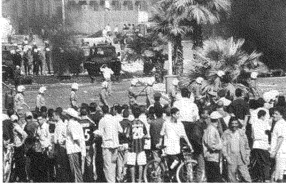
إذا استطعنا محاصرة انظمتنا بعمل ممنهج أحدثنا تغييراً جزيئياً في خياراتنا

علناً وبدون استحياء هي اليوم مختبئة في جورها، بفعل جذوة الانتفاضة التي تفجرت في وجوههم وأبطلت دعاويهم. لكن الوعي الاستراتيجي بقضية فلسطين غائب عند الكثير من الأحزاب والنقابات والجمعيات، للأسف. وكثير من هذه الجهات تعيش حالات من الأنانية الذاتية والانتكاسة والانغلاق على الشأن المحلي والوطني. وقد ينضاف إلى ذلك، الجهات التي تهدف إلى الركوب على القضية الفلسطينية بغية الوصول إلى تحقيق شعبية جماهيرية أو تسجيل موقف أو استعراض عضلات. وأما الجهات التي لها رؤية قومية أو دينية مركزية، فتعاني افتقاراً إلى الأدوات المعرفية الناضجة، وإلى اليات الحدثة بمعناها التقني. كما تشكو من غياب التنسيق في ما بينها، في حين يحتاج النضال من أجل القضايا القومية الكبرى، مثل قضية فلسطين، إلى تنسيق واسع وعميق. فنحن لا نقاتل إسرائيل وحدها، ولا نقاتل أميركا بمفردها، وإنما نقاتل قوةً دوليةً تسود العالم وتحكمه بالتكنولوجيا والعمل الاستخباراتي الدولي وبالدراسات الاستراتيجية والمستقبلية، وتحكمه بالحديد والنار وبالأسلحة النووية وبالمؤسسات المالية الخطيرة.