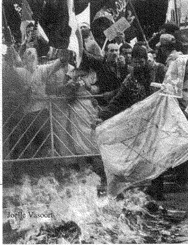
لا شيء يمكنه أن يفت في عَضد الفلسطينيين مثل صمت الشارع العربي