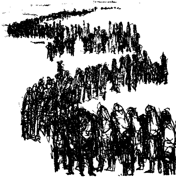
من «البوم من وحي النزوح» للفنان الفلسطيني عبد عابدي

من أجل قمع المقاومة الفلسطينية حتّى مسؤولٍ إسرائيليٍّ رفيعٍ في أوائل عام ٢٠٠٢ الجيش الإسرائيلي على «تحليل الدروس واستدخالها حول الكيفية التي قاتل فيها الجيش الألماني في غيتو وارسو». ويبدو أنّ الجيش الإسرائيلي قد اتّبع نصيحة ذلك المسؤول، بالنظر إلى المذبحة الإسرائيلية في الضفة الغربية والتي بلغت أوجها في عملية «الدرع الواقية»: من استهداف سيارات الإسعاف الفلسطينية والطواقم الطبية، إلى استهداف الصحفيين، وقتل الأطفال الفلسطينيين «للتسوية» (على نحو ما ذكر كريس هُدْجِر، الرئيس السابق لمكتب نيويورك تايمز في القاهرة)، وتجميع الذُكُور الفلسطينيين الذين تتراوح أعمارهم بين ١٥ و ٥٠ سنة وتقييد أيديهم وتكميم عيونهم ووضع أرقام لهم على معاصمهم، وتعذيب المعتقلين الفلسطينيين دونما تمييز، وحرمان المدنيين الفلسطينيين من الطعام والماء والكهرباء والمعونات الطبية، وشنّ الهجمات الجوية العشوائية على الأحياء الفلسطينية، واستخدام المدنيين الفلسطينيين دروعاً بشرية، وجرف المنازل الفلسطينية بسكّانها المتكوّمين داخلها. (٤٨)