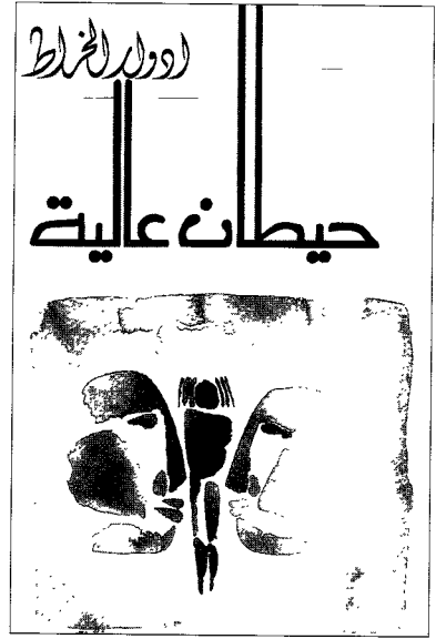
أُحصيتُ في الكتاب ١٩ موضعاً كان للرقابة «الطهرانيّة» عدوانٌ عليها

أُحصيتُ في الكتاب تسعة عشر موضعاً كان لهذه الرقابة الطهرانيّة عدوانٌ عليها من هذا القبيل. ولا بدّ أن أعترف أنّي شاركتُ في هذا العدوان قسراً، إذ كان الخيارُ بين أن يُنشر الكتابُ معدّلاً كما تشاء السلطةُ أو أن يُمنع من النشر أصلاً. في الطبعة الثالثة عاد للنصّ اكتماله.