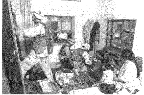
الاحتلال الأميركي كولونيالي من طراز قديم، وأما الاحتلال الإسرائيلي فيعود إلى حلم خلق وطن لليهود وحدهم