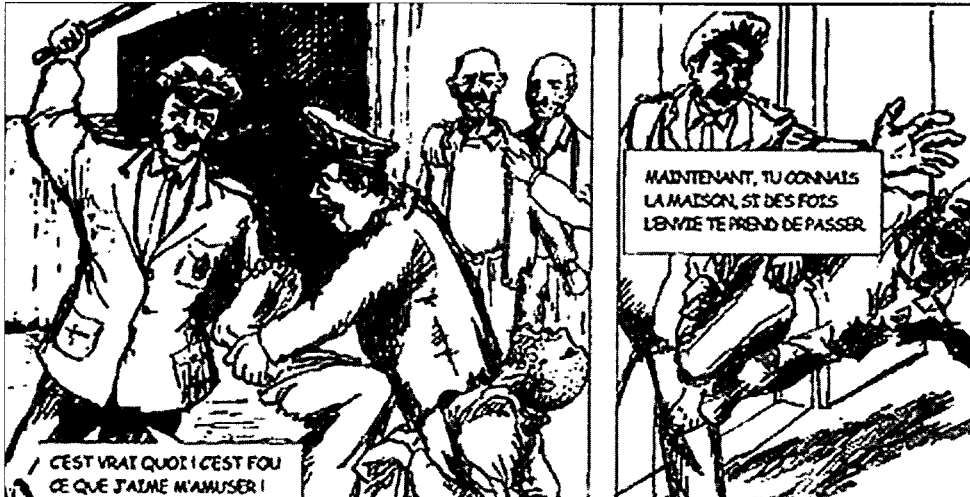
من رسوم أخرى لمريد

كانت الوليمة دسمة. تداعت الضربات سياطاً. ثلاث تعقبها ثلاث. توالى الكلمات شتمةً بذيئاً. لسان يعلوه لسان. ومن السابع جاء العدة: ست وستون جلدة ولما ينشف الجسد بعد. نَظَرَ إلى ساعته. دُونَ الفجر ساعتان. مزيداً من الأطباق إذن. وصرخت فيهم، فيه: «يا فاجرًا هات عذابك، ومث في غيظك: فقد سلمتني بوابات الشهوة كل المفاتيح.» وواصلت حديث العشق والإبحار وتوهم الشهوة المستحيلة.