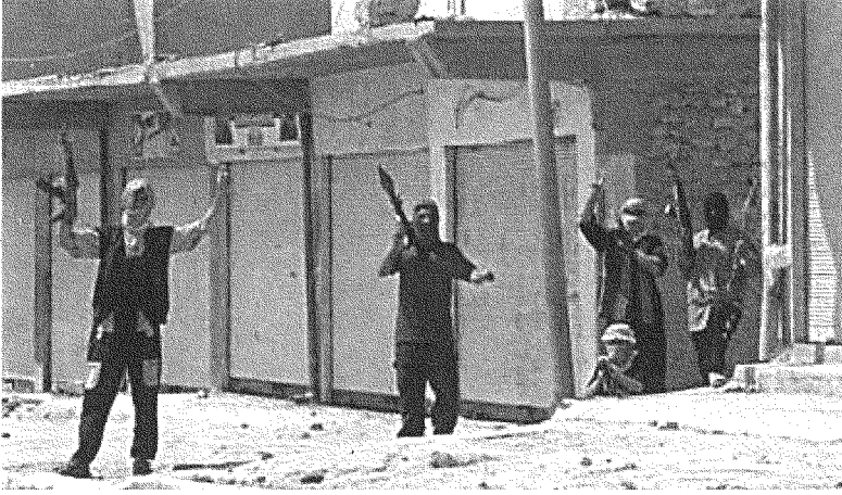
تبخّرت عنتريات محافظ الجف وسبّطرت عناصر جيش المهدي على الصحن الحيدري ومدينة الجف