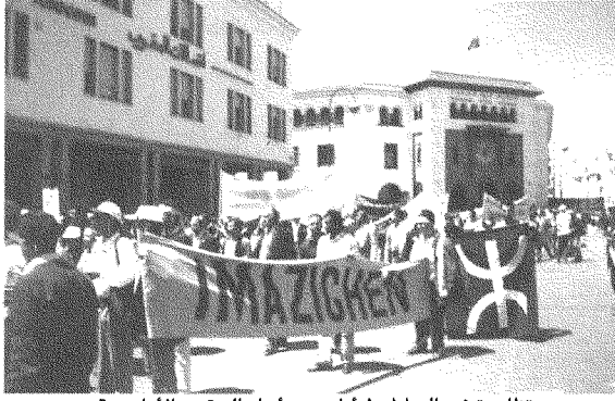
تظاهرة في الرباط، ١ أيار، من أجل الحقوق الأمازيغية

ذاك فلنتحمل كلَّ المسؤوليات التاريخية عمَّا سنجنبه على شعوبنا من تدمير حضاري ومن مسخ للشخصية الحضارية. وأشدُّ ما نخافه هو أن تكون الغاية من الحضور السرطاني لفرنسا (بأجهزتها الضخمة) في موضوع الأمازيغية هي جعل القضية الأمازيغية خصمًا عنيداً للبعد الحضاري العربي الإسلامي للمغرب. وإلا فكيف نفسر هذا التنازح الحاد بين عبد السلام ياسين والأستاذ محمد عصيدي؟ إنَّ الدخول في مثل هذا النوع من الصراع من شأنه أن يضئع علينا الوقت والفُرص. إشكاليتنا، نحن المغاربة اليوم، ليست التمزيع ولا التعريب، لأننا نعلم أنَّ المستفيد الأول هي اللغة الفرنسية. وإنما إشكاليتنا هي التمير على الديمقراطية وعلى بناء ديمقراطي يجب على كل حاجات الإنسان المغربي، وهو الكفيل وحده بحلِّ خلافاتنا.