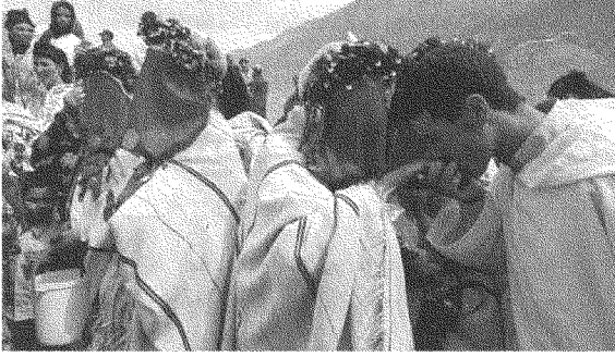
عرس بربري في أعلى جبال الأطلس في المغرب

المؤسسات، بأشياء ملموسة لصالح الأمازيغية: فعلى مستوى ممارسة الدولة يُعتبر تأسيس «المعهد الملكي للثقافة الأمازيغية» مدخلاً لتصالح المغرب مع ذاته، وأحد أدوات تحقيق مطالب الحركة الثقافية الأمازيغية.