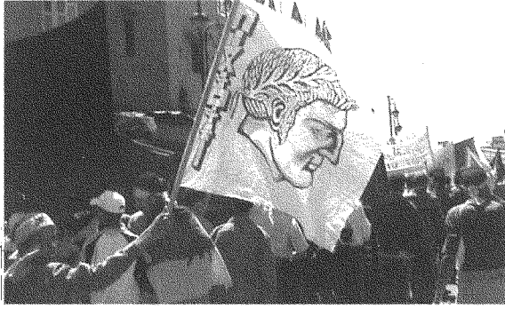
تظاهرة في مراكش، تحمل صورة ملك الأمازيغ ما قبل مجيء العرب، أيار ٢٠٠٤

المسعودي: في إطار الدولة الوطنية الديمقراطية سنحلّ الإشكال اللغوي والثقافي