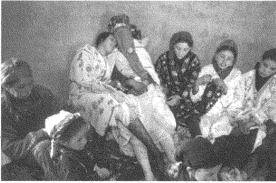
نساء في شرق أعالي جبال الأطلس، يرتحن بعد عرس

وكانت الفترة الفاصلة بين عامي ١٩٦٧ و ١٩٩٠ فترة نشأة وترعرع الخطاب الثقافي الأمازيغي، الذي انطلق من الأسئلة التي عكستها تناقضات الواقع المغربي، وتمكّن من إعادة تأسيس مفاهيم الحركة الوطنية عبر تازيمها - ولاسيما مفاهيم «الوحدة» و«الهوية» و«اللغة» و«الثقافة» و«التاريخ».