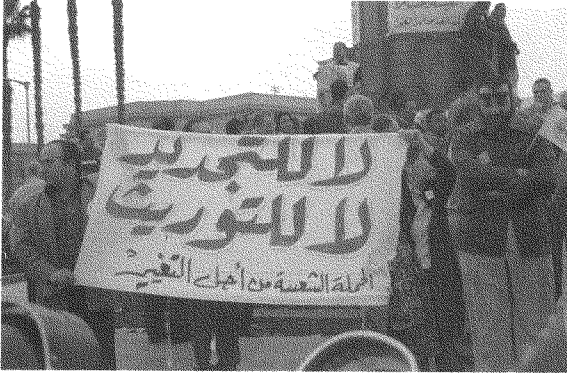
من شعارات التظاهرات الأخيرة في مصر: لا للتوريث، لا للتوريث

للنهضة الذي كانت التجربة الناصرية أسطع نماذجها، بينما تبذل قوى الاستعمار العالمي كلَّ جهدها لمحاصرته وإطفاء جذوته، في الوقت الذي أُغلقت فيه الطرقُ على المشروع الاشتراكي بعد زوال الاتحاد السوفيتي، وهمّشت الأحزاب الشيوعية دورها مكتفية بالدعوة إلى الإصلاح السياسي. ومن ثم لم يعد مرثياً للحركة في الواقع الفعلي سوى أفق واحد، هو تعديل شكل الحكم السياسي وتطويره في إطار النظام ذاته، وذلك بطرح انتخاب الرئيس من بين أكثر من مرشح، وإلغاء حالة الطوارئ، وتوسيع دائرة الحريات العامة، وغير ذلك. ويبدو أن تلك هي المهمة الوحيدة الممكنة الآن، التي يساعد تحقيقها على خلق ظروف أكثر ملاءمةً لنضال شعبي واسع من أجل الأهداف الوطنية والتحرر الاقتصادي والاجتماعي.