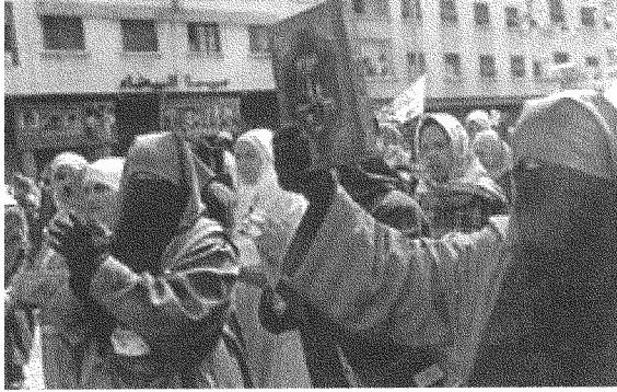
ثمة عنف شرس ضد الفعل الإسلامي والشبابي المحسوب على الحركات الإسلامية

نجده يبدي استعداداً عارماً للمشاركة السياسية، وإلا فلماذا أخفق مشروعُ التناوب السياسي (إذا كان مناسباً أن نتحدث عن إخفاق هذه التجربة) في تحقيق مشروعه التغييري؟ ليس لأنَّ المجتمع لم يحتضنْ هذه التجربة ولم يحولها إلى واقع ملموس يصعب تجاوزه، علماً أنَّ الفئات الشعبية كانت هي المستفيد الأكبر من نجاح واستمرار ذلك الخيار الديمقراطي الذي عبَّرتْ عنه حكومةُ التناوب السياسي برئاسة الأستاذ عبد الرحمن اليوسفي؟