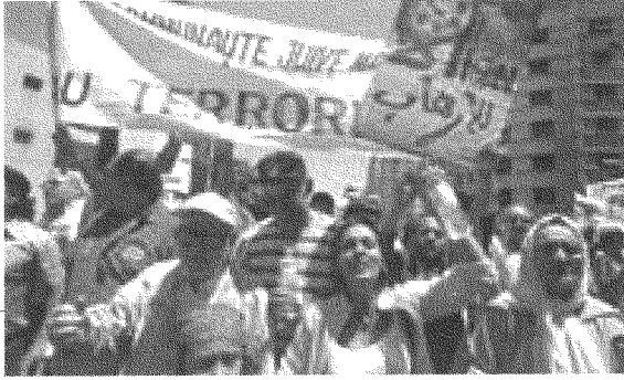
ما معنى أن نقوم اليوم بمشاركة الشباب في السياسة، والأرقام الحقيقية في حوزة وزارة الداخلية؟!

أنا نعلم أنها لا تمت إلى الواقع بصلة! ولن نستطيع استجلاء الوضع السياسي الحقيقي في البلاد وبناء نظريات علمية حول المشاركة السياسية، سواء لدى الشباب أو لدى غيرهم من الفئات العمرية، إلا عندما نحسم مع احتكارية «المخزن» المغربي لقاعدة المعلومات.