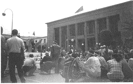
المهام الأصلية للتنظيمات الشبابية تتجسد داخل قطاع الجامعة ووسط القطاعات الطلابية

لمقاربة هذا السؤال لا بد من الإقرار بأن الأداء السياسي للتنظيمات الشبابية، رغم كل الهزات العنيفة التي تعرضت لها، كان في المستوى المطلوب فعلاً؛ فقد كانت هذه التنظيمات في طليعة النقاش السياسي داخل أحزابها، وكانت دوماً متقدمة فيه. لكن يجب، في المقابل، التنبيه إلى أن مهامها الأصلية، التي يكمن فيها قصور واضح، تتجسد داخل فضاء الجامعة ووسط القطاعات الطلابية. وهذه، في اعتقادنا، هي أورش المستقبل وأورش ضمان استمرارية الأداء السياسي للتنظيمات الشبابية الوطنية الديمقراطية.