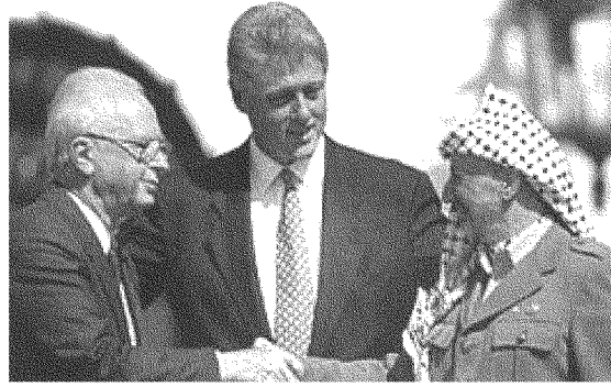
كان شرابي شديد التحفظ عن اتفاق أوسلو

وجورج حبش، ورئيس منظمة التحرير الفلسطينية ياسر عرفات، إلا أن هذه الصلة لم تمنعه من نقد السياسات الفلسطينية كلها، ولاسيما سياسة منظمة التحرير بالتحديد. وفي هذا المجال كان شديد التحفظ عن اتفاق أوسلو (١٩٩٣/٩/١٣)، وطالما ردّد أن اتفاقي القاهرة وطابا