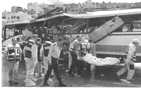
«قول لا عبر القذف بأجسادنا... قد يُسبنا الجنة، لكنّه لن يعيد إلينا فلسطين»

المنطقة، لكنّ الجوهر الأهم هو نهضة الأمة السورية والثورة القومية الاجتماعية. وكان وثاقاً جداً بأنّ الحركة القومية الاجتماعية ستنتصر، وأنّ فلسطين ستتحزّر. وأكثر من ذلك، كان على يقين بأنّ عودة الإسكندرون وكيليكيا وتوحيد الأمة آتيان بلا ريب. (١)