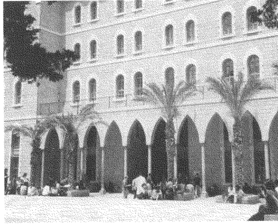
يعترف شرابي بأن الجامعة الأميركية في بيروت لم تعلمه المنهجية ولا البحث بالمعنى الصحيح

على مستوى واحد (ص ٤٢)، وساد عنده وعند زملائه الطابع الإنشائي الأدبي، وكراهية الأرقام والإحصاءات، حتى إنه كان لا يفهم معنى مصطلحات أساسية تُعدّ بديهية في الأبحاث العلمية (ص ٤٣). صحيح أنه حاول طويلاً أن يتحرّر من هذا النمط الذي زرعه الجامعة، «غير أن العملية استغرقت وقتاً طويلاً قبل أن تكتمل» (ص ٤٤). والمؤسف أنه لم