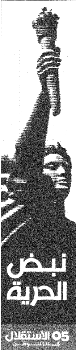
«نبض الحرية» بتمويل من «روح أميركا»!

تقول منظمة «روح أميركا» على موقعها الإلكتروني (١) إنها تأسست «في أعقاب أحداث ١١ أيلول الإرهابية» لمساعدة «من يدفعون قداماً بالحرية والديموقراطية والسلام في الخارج... على خطوط المواجهة»، أكانوا جنوداً أميركيين في العراق وأفغانستان، أم طواقم مدنية، أم أشخاصاً يطلبون المساعدة من الأميركيين في نضالهم من أجل الحرية والديموقراطية. وفي المجال الأخير تفتخر «روح أميركا» بأنها أسهمت في شراء محطات تلفزة عراقية من أجل تأسيس «بديل أفضل من قناة الجزيرة». كما تفتخر أيضاً بأنها قدمت الدعم إلى المتظاهرين المؤيدين للديموقراطية في بيروت (لبنان) من أجل مسيرتهم نحو الديموقراطية، «فأنشأت موقعا إلكترونياً لجمع التبرعات لهم. وتؤكد تريش شوه أن «روح أميركا» هي التي خلقت موقع «نبض الحرية» الإلكتروني، وقدمت للمتظاهرين «ساعة