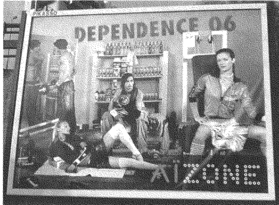
من «استقلال ٠٥» إلى «تبعية ٠٦»: سوريا براً، وأهلاً بالاستهلاك!

طبعاً، علينا أن نذكر من نسي، أو تناسى، بأن كل هذه العمليات والنظريات تأتي في إطار تمددنا وتحضيرنا لا غير، بما في ذلك دعم «ثورة الأرز» في لبنان و«ثورة الياسمين» في سوريا (وربما ستزكم أنوفنا بالياسمين قريباً). وكلها ينبغي أن نذكرنا - ككتاب ومثقفين - بالرسالة التمديدية mission civilisatrice الاستشراقية المعروفة التي مهدت الأرض الفكرية لاستعمارنا... من أجل تخليصنا من تخلفنا.