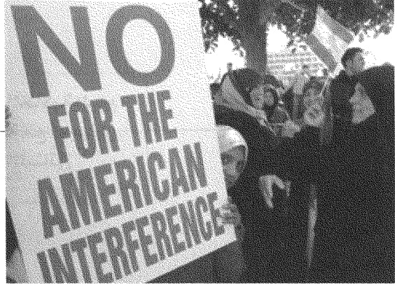
تمثّل الانقسام المذهبي العميق في أضخم تظاهرات في ٨ و ١٤ آذار، على الرغم مما حيك من أساطير كاذبة حاول طابع الثانية التوحيدي

أ - تعاضّم موقع البرجوازية المصرفية، ورأس المال المالي، عموماً، حيال الشرائح الأخرى من البرجوازية المحلية، كما حيال المجتمع ككل، بحيث انعكس هذا الواقع بعمق على وضع القطاعات الإنتاجية، وبخاصة الصناعة والزراعة، فتراجعت تراجعاً واضحاً، سواء في وزنها الإجمالي على مستوى الاقتصاد والدخل القومي، أو في الدور السياسي للكتلة الاجتماعية التي تتخذها مصدراً أساسياً لمعيشتها