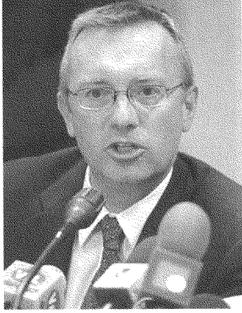
الحسم السياسي اللبناني بات يشغل على طريقة الدمى المتحركة، بضغوط من السفير الأميركي فيلتمان، ومن موفدين أميركيين