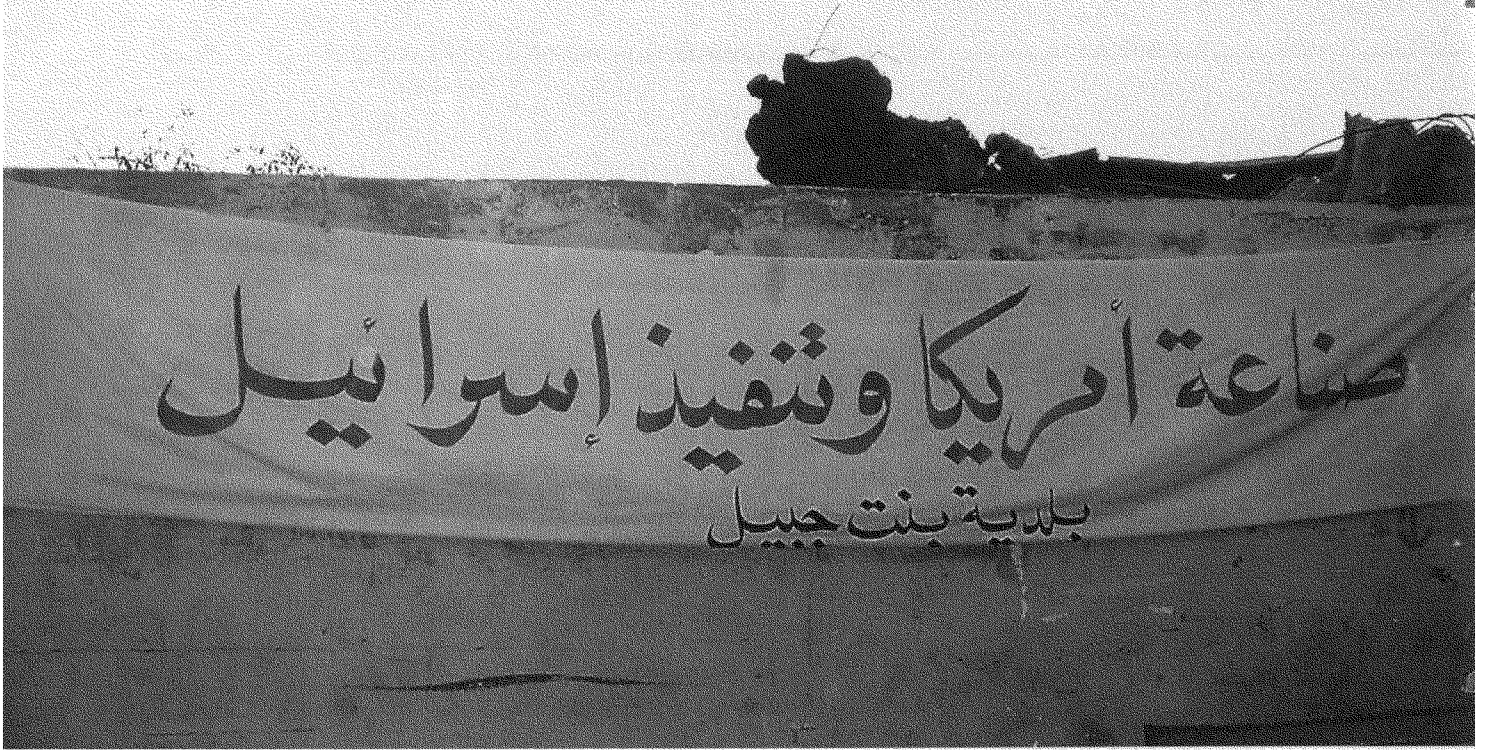
يافاطة في بنت جبيل