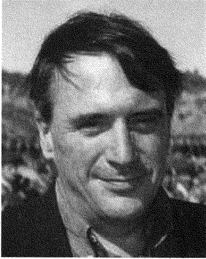
بيتر غالبرايث: «المواطن الكردي الفخري»

يرحب مدير المعهد لشؤون السلام والاستقرار دانيال سيروير بالحضور خلال ندوة عن الاستفتاء، ويُطعمهم على البرنامج، قائلاً: «سنستضيف الخميس القادم بيتر غالبرايث، الذي من الإنصاف القول إنه فاضلٌ باسم الأكراد. بت أنادي بيتر بالكردي المولود من جديد (Born Again Kurd)». يقاطعه أحد المشاركين: «إنه كردي فخري». فيوافق سيروير: «إنه مواطن كردي فخري».