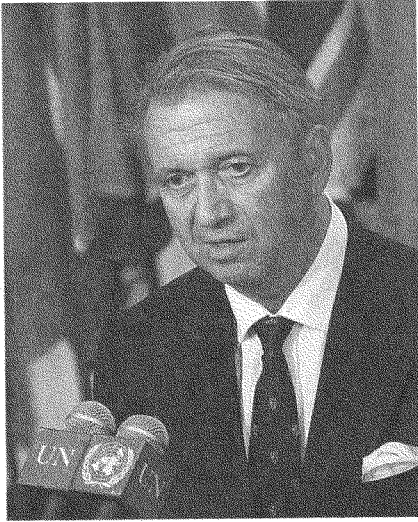
تيري رود لارسن: دور مفصلي في مراحل حساسة من الاستعمار!

مساءلة أو تفويض لمصادقية خطابه. كما يُسمح له بتأكيد الفصل بينهما: فيجزم في مستهل الخطاب بأنه يتكلم بصفته العلمية، (٢) ثم لا ينفك يكشف لمن يخاطبهم عن سطوته السياسية عبر تذكيرهم بين الفينة والأخرى بدوره الفاعل في مجرى الأحداث المهمة، كالانسحاب الإسرائيلي أو السوري من لبنان أو الانتخابات النيابية اللبنانية في صيف ٢٠٠٥ أو حرب تموز ٢٠٠٦. ويكتمل تجسيد رود لارسن للخطاب الاستشراقي في «إطّلاع» أهل المنطقة (ومن على أرضهم بالذات حيث يلقي محاضراته) على واقعهم. ولأنه «يعي» طبيعة شعوب الشرق الأوسط، فإنه يؤكد أن الصراعات التي تعصف بهذه الشعوب ليست نتيجة لـ «صدام الحضارات» بل نتيجة لـ «صدام القيم» ضمن المجتمع الواحد. ويتحدث رود لارسن عن تحوّل جذري في أولوية هذه النزاعات، مشيراً مراراً (و«بموضوعية» العالم العارف) إلى صعود النفوذ الفارسي واحتمال اصطدام القومية الفارسية بالقومية العربية، مثبتاً انتهاء الحقبة التي تبوأ فيها الصراع العربي - الإسرائيلي وحده قائمة ما يحول دون تحقيق سلام دائم!