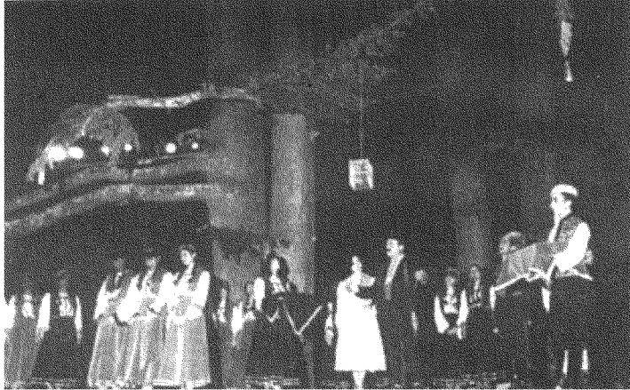
مسرحية بياع الخواتم (١٩٦٤): اليوتوبيا الرحبانية - الفيروزية.

وميشال طراد الذي يمثل مناخاً غنائياً عاماً، واجتذبت أشعاره الألحانَ وغناها كبارُ المغنّين وبينهم فيروز، يُكثر في شعره من التغني بصنّين والخيمة والعين والسلة والقمر. ويشيع في شعره الوصفُ الفردوسي للقرية، وعلاقات الناس فيها، وعلاقتها بالطبيعة. يقول في ديوان جلعانار: «ع طريق العين مَحَلًا التكتكي/ والقمر ع كتف صنّين متكي...» ثم: «ه الخيمة اللي كان يضحكلا النجم/ ه الأكان حَيْطًا مرتكي ع صنوبرة...» (٦) ثم: «تَحْمين راحت حلوة الحلوين/ وما ضلّ في غير الحَبَق.../ ولا عاد رَحْ تلعب على التلّية/ ولا يُداعبا