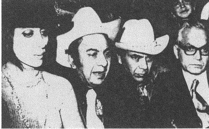
فيروز وعاصي ومنصور وصبري الشريف (١٩٧١).

ما يتوجّب الوقوفُ إزاءه هو أنّ الأغاني الرحبانية قد خرجت عن سجلّ الموضوعات الغنائية العربية السائدة، وعن هيمنة الأغنية المصرية يومذاك: أيّ