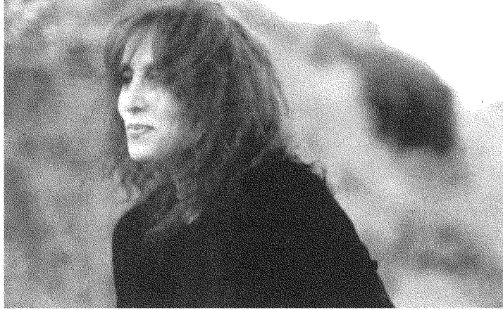
كيفك إنت؟ (١٩٩١): فيروز مع زياد.

٧ - استكملت عمليّة استنفار العناصر والمكونات والمفردات بترميز يعود إلى الرؤية الشعرية لهذا العالم. وجاء ينتشل عالم القرية من أسر زمنيّتها، ليقدمها صورةً حلميةً لفرديوس مفقود، أو يوتوبيا وئام مرتجى. وهي صورةٌ لا تَبْرأ من الميتافيزيقيّ الخارق والمسحة الخرافية، اللذين يولدان الروح الرومنسية في الأعمال الرحبانية.